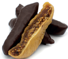
VIJGEN UIT IZMIR